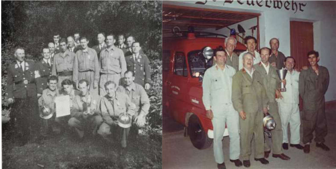
Feuersbrunn 1976 1. Platz bei FF Bewerb

Von der Landwirtschaft wurde je Hektar Grund zehn Schilling eingehoben und auch der Überschuss aus der damals bestehenden Druschgemeinschaft trug dazu bei die Tragkraftspritze zu kaufen.