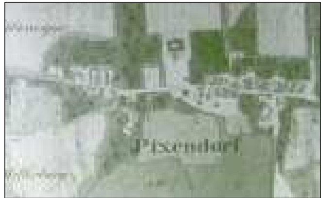
Pixendorf um 1830

1835 beschrieb Schweickhart in seiner „Darstellung des Erzherzogtums Österreich unter der Enns“ Pixendorf so: