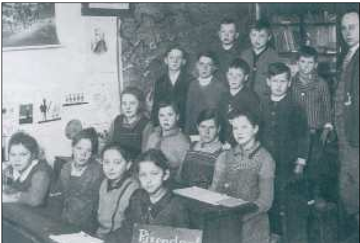
Volksschule Pixendorf, 1934

Zu Beginn des Schuljahres ging der Lehrer mit den Kindern nach Michelhausen, um dort mit den übrigen Schulen der Gemeinde die Eröffnungsmesse mitzufeiern. Der Erlass des Bezirksschulrates vom 13. April 1899 schrieb vor Beginn des Unterrichtes das Gebet „Heiliger Geist“ und am Schluss das Vaterunser sowie freitags das Gebet zur „Scheidung Christi“ vor.