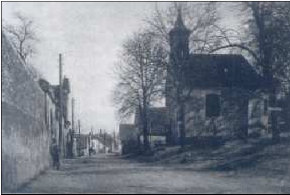
Ortskapelle Pixendorf, 1944

Die im Zweiten Weltkrieg neuerlich eingezogenen Glocken ersetzte man zwei Jahre nach Kriegsende. In der Schulchronik Pixendorf heißt es: