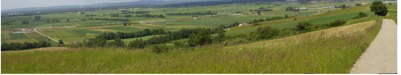
Tullnerfeld Panorama 2006