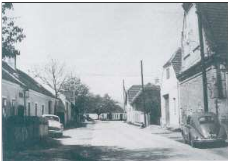
Hintergrund: Kaufhaus Wimmer

Am 5. Mai 1948 begann die Pflasterung der Ortsdurchfahrt mit Kleinschlagpflaster. Nach der Verlegung der Wasserleitungs- und Kanalrohre wurde das Pflaster 1984 durch eine Asphaltdecke ersetzt.